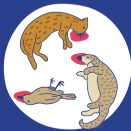
野生動物誤食後死亡